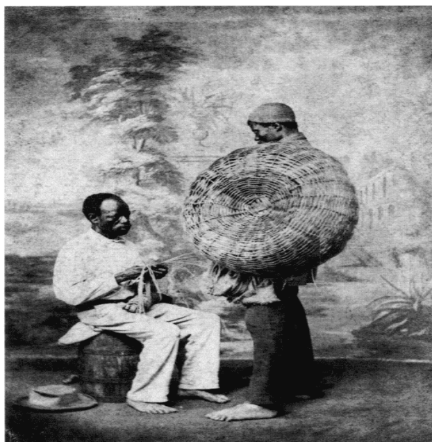
Figura 6 – Livro – História – História e Vida Integrada – volume 3

Escravos urbanos geralmente eram utilizados para o 'ganho', chamados 'escravos de ganho', tinham que trabalhar em alguma atividade especializada e entregar seu rendimento ao senhor.