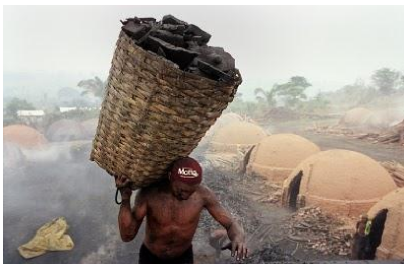
Figura 11 – Livro – Geografia – Construindo Consciência, volume 2