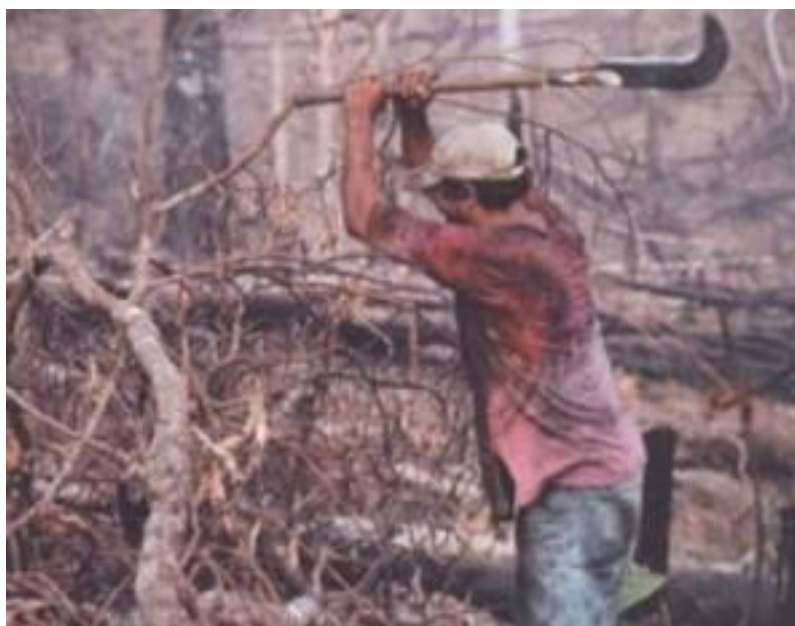
Figura 13 – Livro – Geografia – Construindo Conhecimento, volume 2

Trabalho escravo no interior da Amazônia.