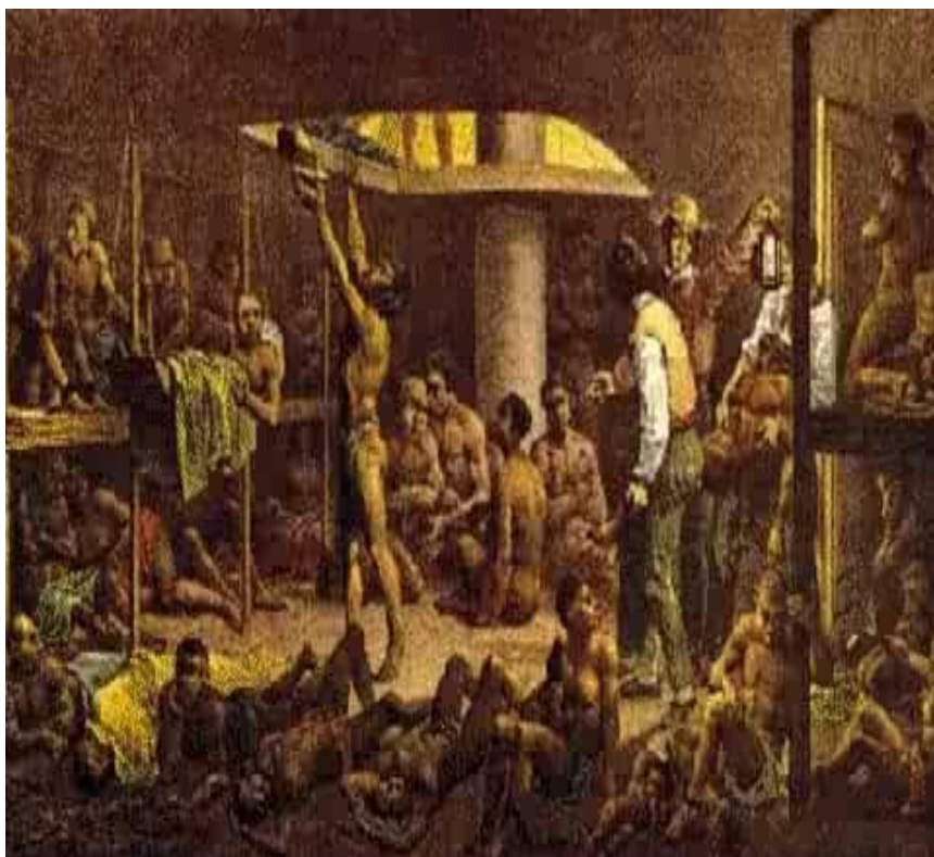
Figura 2 – Livro – História – História e Vida Integrada – volume 3

Interior de um Navio Negreiro. No centro, um negro pede água ou comida. (Rugendas)