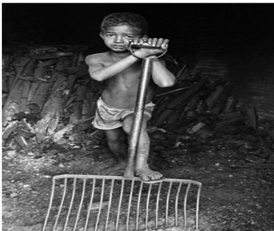
Figura 11 – Livro – Geografia – Construindo Consciência, volume 2