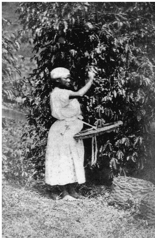
Figura 1 –Livro- Geografia- Construindo Consciência – volume 1

Escrava colhendo café. Imagem de 1865. Escravos que trabalhavam na lavoura tinham menor expectativa de vida, uma vez que sofriam mais.