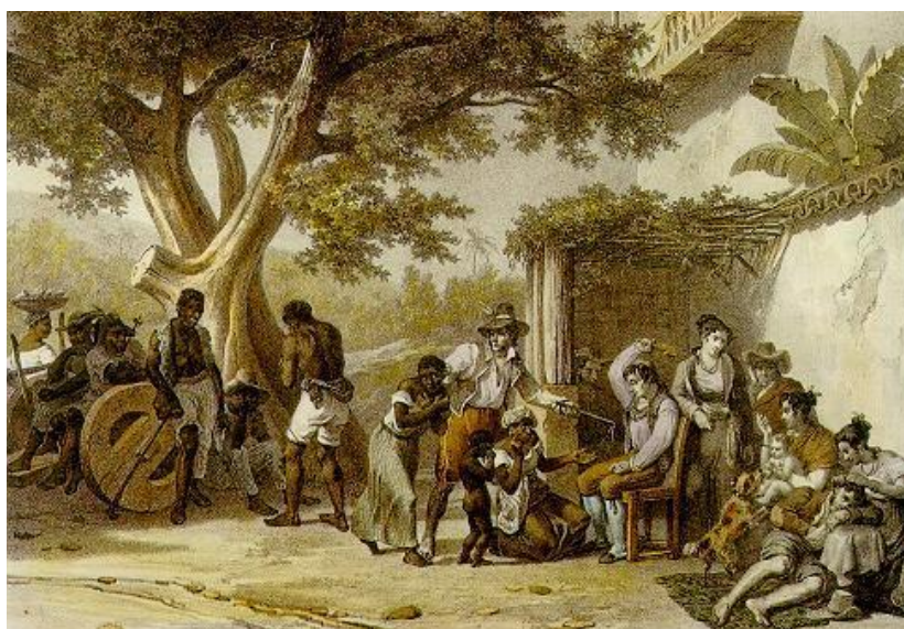
Figura 8 – Livro – História – História e Reflexão – volume 3