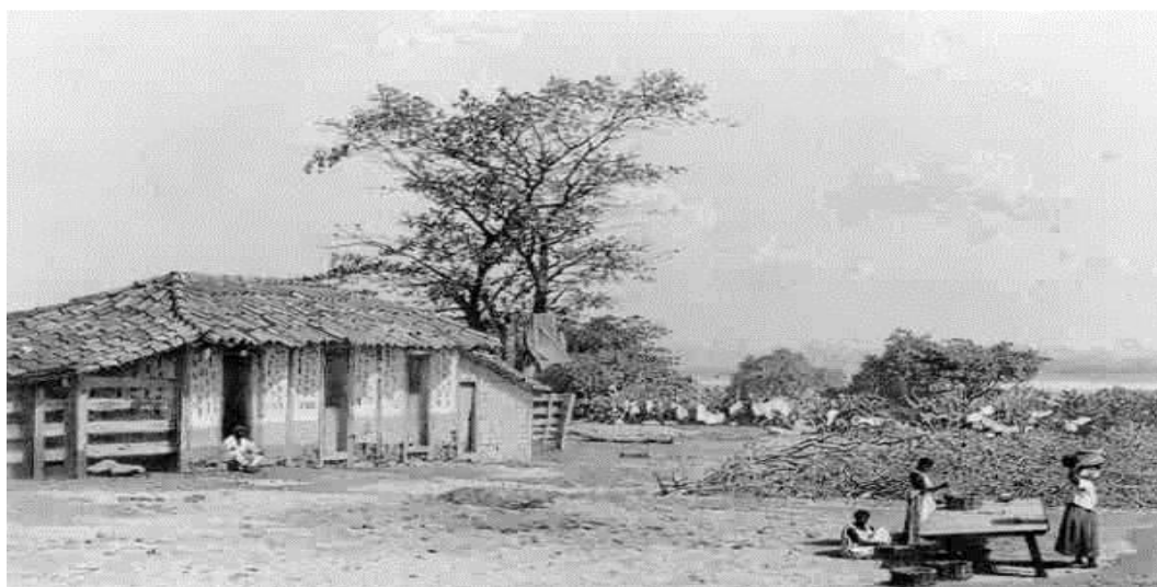
Figura 5 – Livro – História – História e Vida Integrada – volume 3

Senzala do Rio de Janeiro. As senzalas geralmente tinham poucas janelas, ficando quase sem iluminação e ventilação.