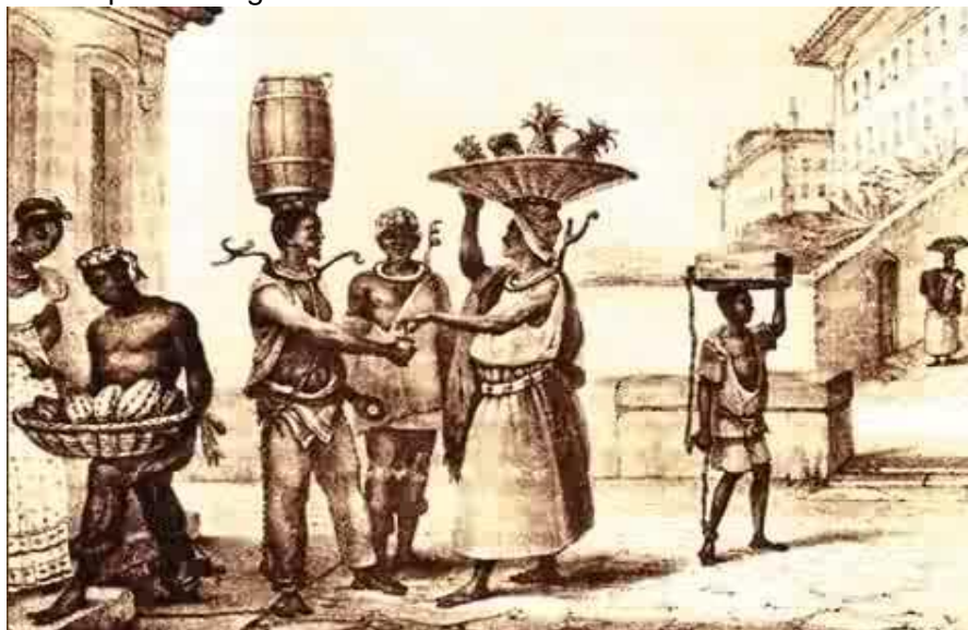
Figura 9 – Livro – História – História e Vida Integrada – volume 2

Colar de ferro. A finalidade desse colar era não só estigmatizá-los como escravos fujões mas também dificultar a sua fuga, já que, ao tentarem abrir caminho no meio do mato a barra de ferro se embaraçaria nos arbustos e acabaria por estrangulá-los.