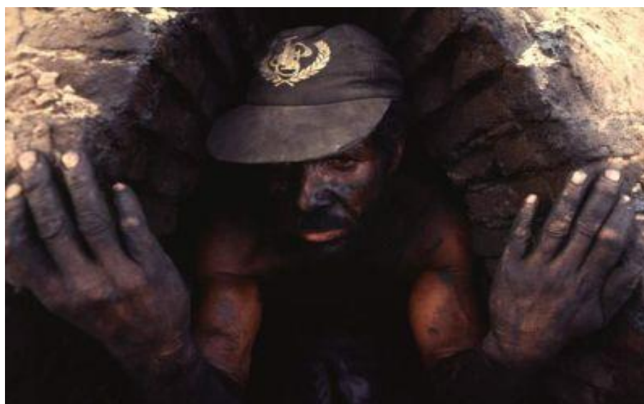
Figura 12– Livro – Geografia – Construindo Conhecimento, volume