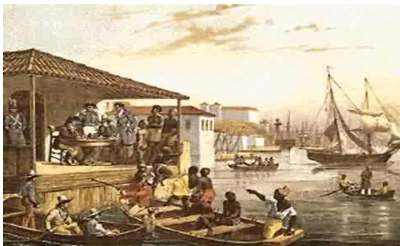
Figura 3 - Livro – História – História e Vida Integrada – volume 3